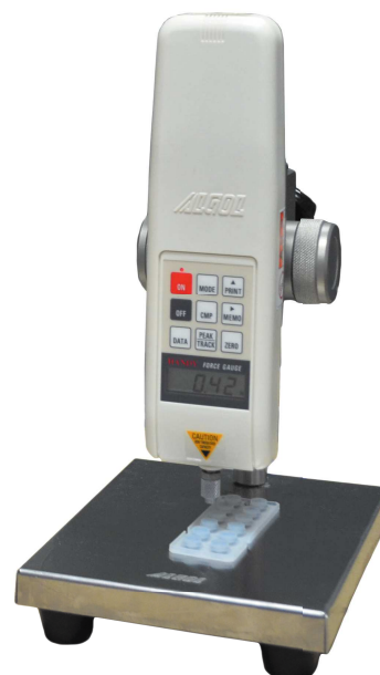
HF-2S & JSV-100N