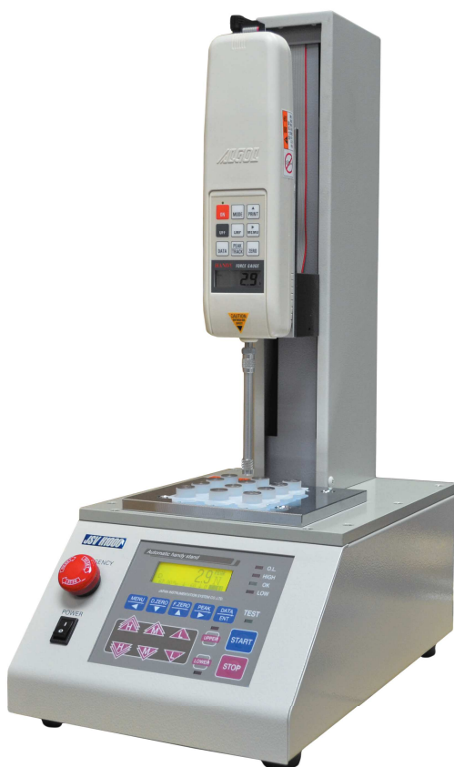
JSV-H1000 & HF-2S